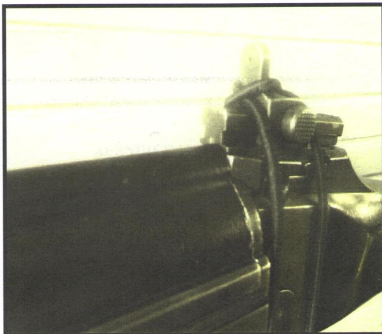
- Colocação de elástico para fixação da alça de mira